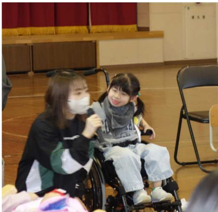
小学部より 体育館で1年生を迎える会を行いました。