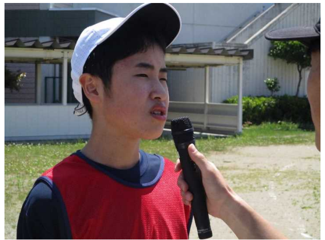
中学部より 今年も運動会を開催！ 総練習風景です。