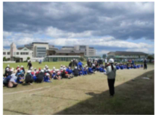
全校行事 避難訓練(地震)を行いました。 落ち着いて避難できました。