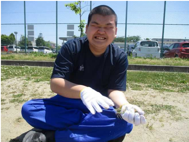
高等部より JRC 活動で校庭の草取りをしました。